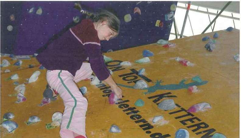
Kindergeburtstags, Ferienangebote und mehr